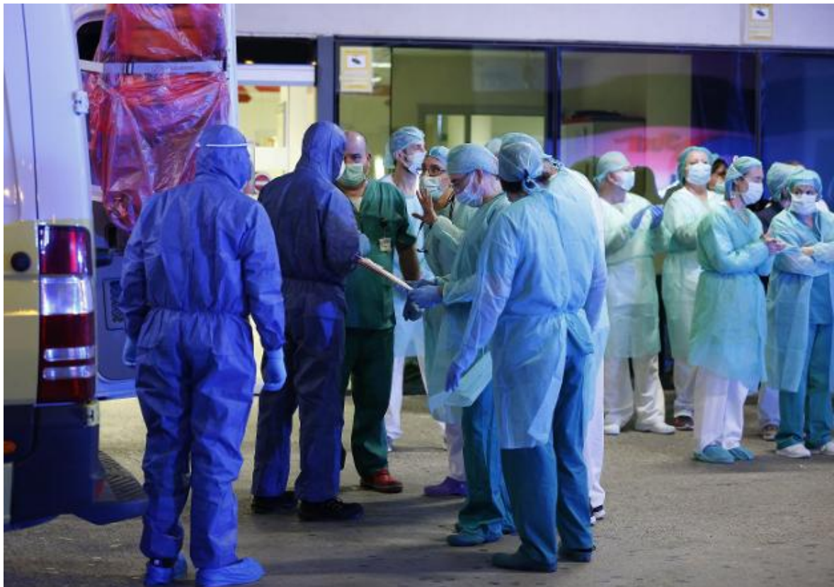
Personal sanitario con equipos de protección, en la puerta de un hospital. jseús signes

Materiales en mal estado, personal insuficiente o protocolos confusos, protagonistas en la comisión de reconstrucción